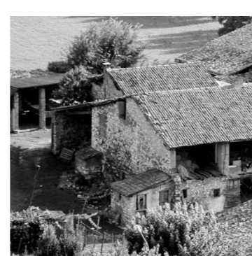
ANTICO Il borgo che verrà restaurato per ospitare il Forum Aquavitae

A partire proprio dai resti di quella chiesetta: «Gli scavi archeologici stanno portando alla luce una chiesa altomedievale, presumibilmente edificata intorno al VII-VIII secolo, in continui-